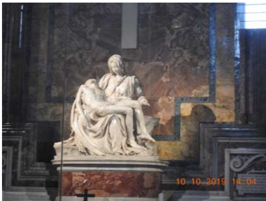
梵蒂冈圣保罗教堂的宝物之一。