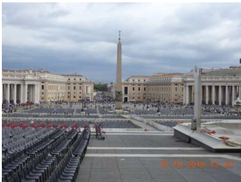
梵蒂冈广场，全世界的天主教圣地。