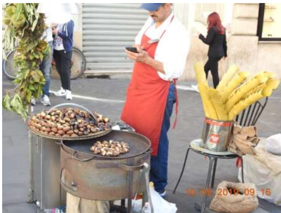
罗马街头的炒板栗。