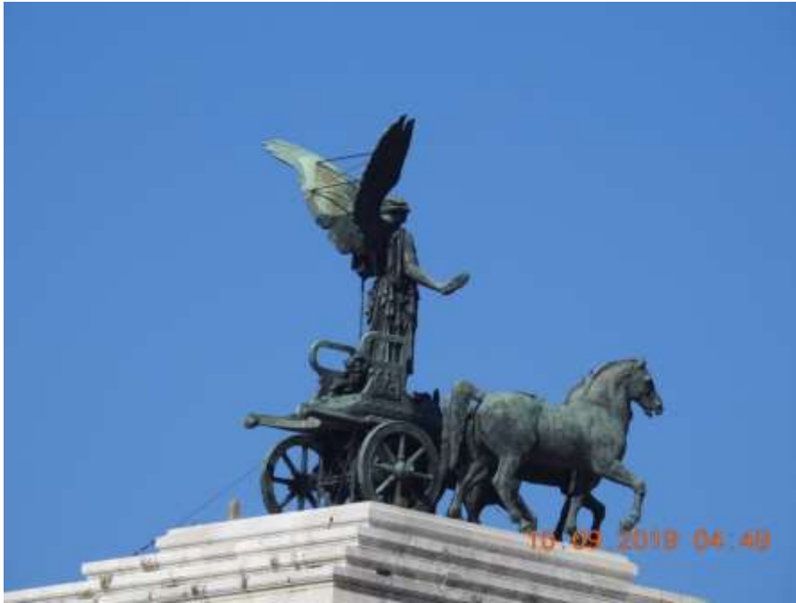
罗马美丽的女郎和骏马

这次旅行历时将近一个月时间，从纽约肯尼迪机场飞到葡萄牙的里斯本，飞行大概 5 到 6 小时，落地休息看看，继续飞到罗马，只有 2 小时飞行时间，在罗马住下来，慢慢悠悠好几天，在罗马上船，第一站到西班牙的巴塞罗那，今年春天刚去过，再次重访，还是很喜欢这个城市。然后乘船沿着地中海走，到了西班牙南部的其他几个城市，穿过直布罗陀海峡，（可惜是晚上，下雨，风高浪急，没拍下相片）进入大西洋，航行数天，回到美国佛罗里达迈阿密，飞行两小时到家。听说穿过地中海到大西洋这段路，飞机不飞，因为很费油，都是从北边走，只有船这么走，很有意义的一段旅行。跟以前比，这次出游身体感觉比较累，但能够还是跑来跑去，坚持下来了，休整一下，11 月中又要去巴拿马运河，大概也要旅行一个月，到时候再给大家汇报。