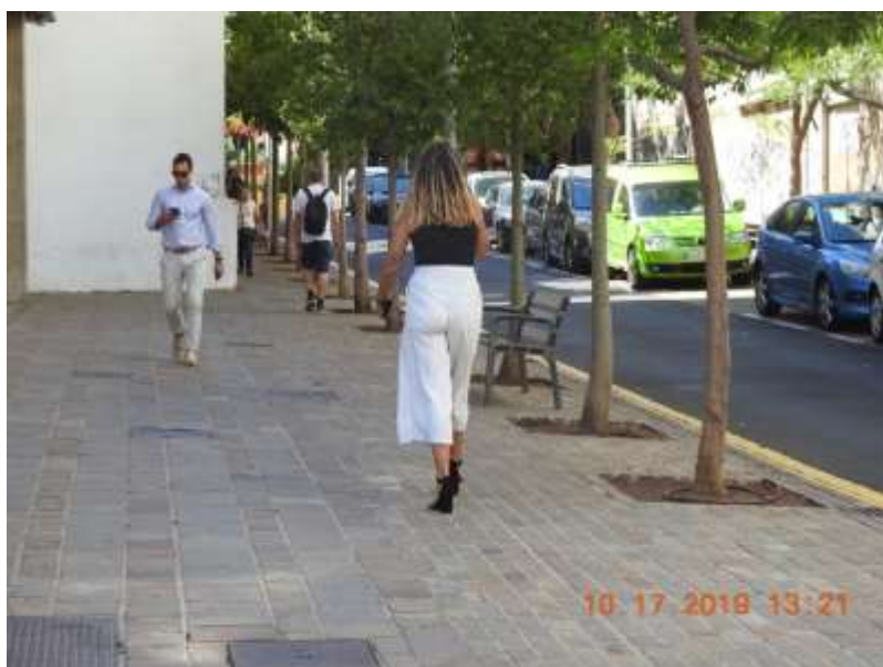
街上偶遇的西班牙先生和女郎，一个帅，一个美。这在美国，还不送去好莱坞演电影啊，西班牙就是一路人，美女帅哥太多了。